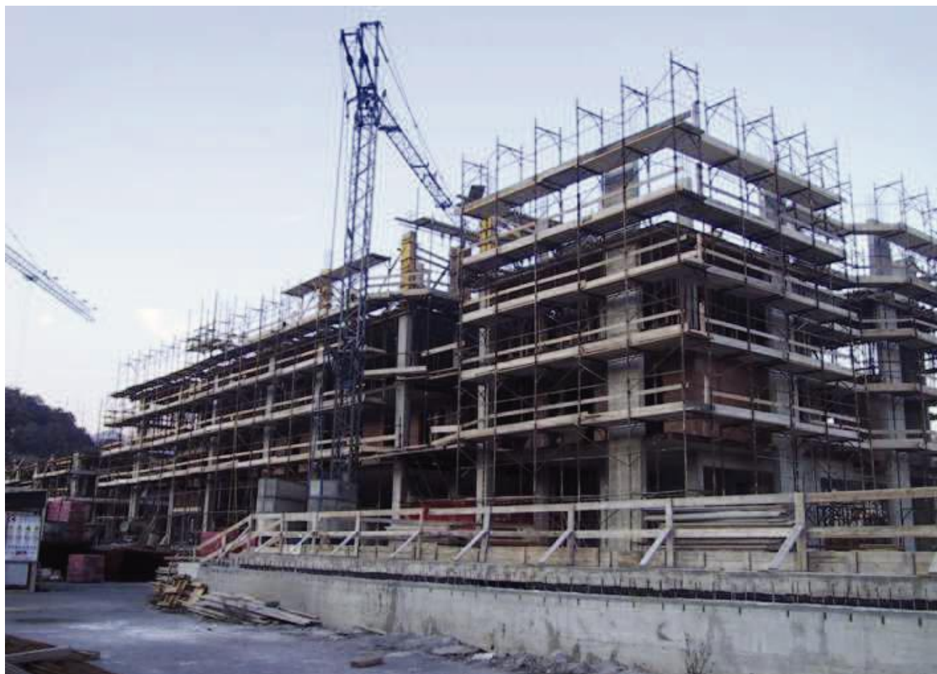
Foto 31 – Programma di riqualificazione urbana delle aree ex Arcos ad Albissola Marina – Comparto 2