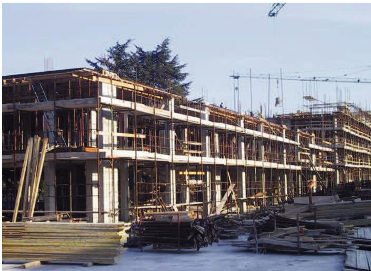
Foto 32 – Programma di riqualificazione urbana delle aree ex Arcos ad Albissola Marina – Comparto 2