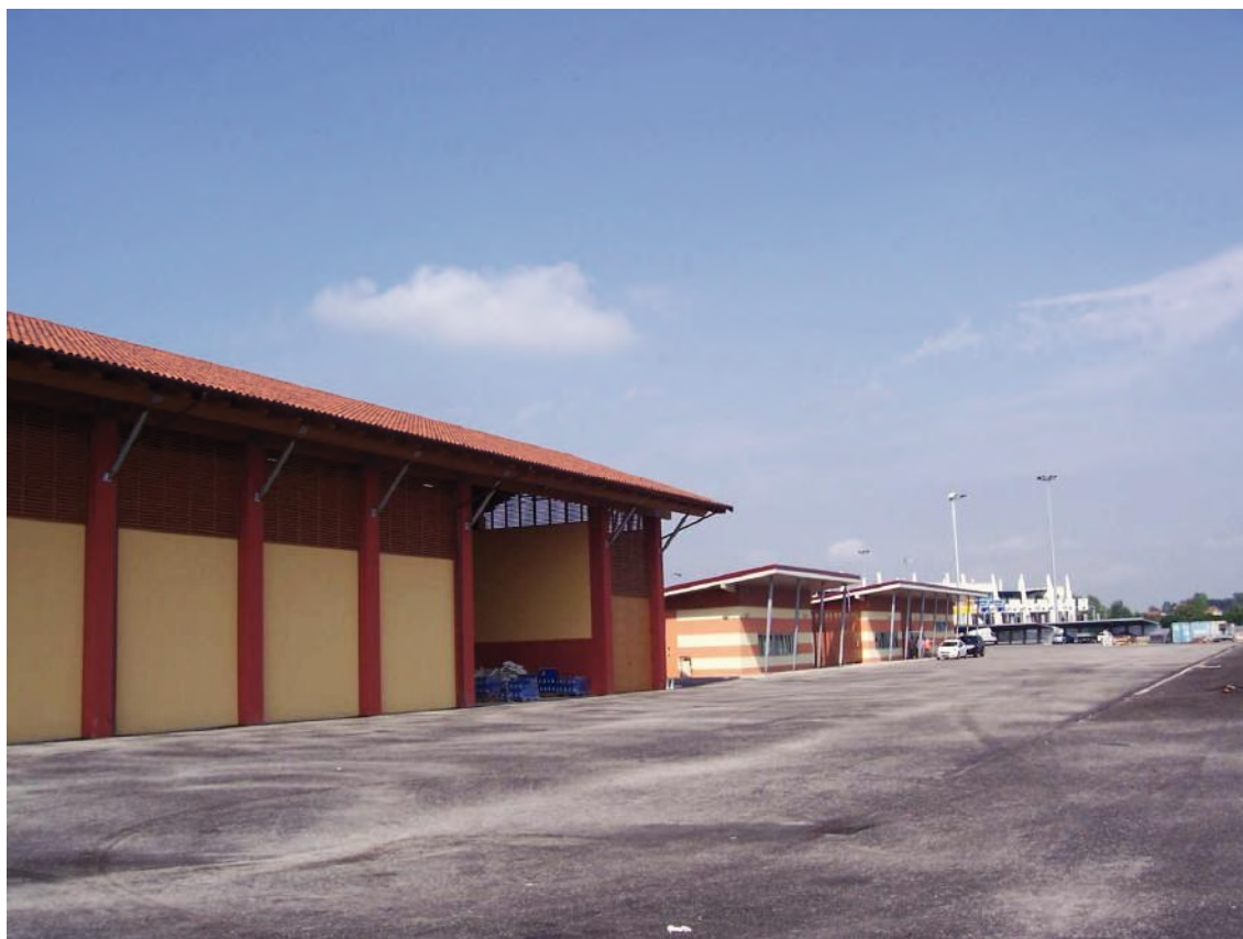
Foto 39 – ATS deposito salgemma e sede Posto Manutenzione Mondovì