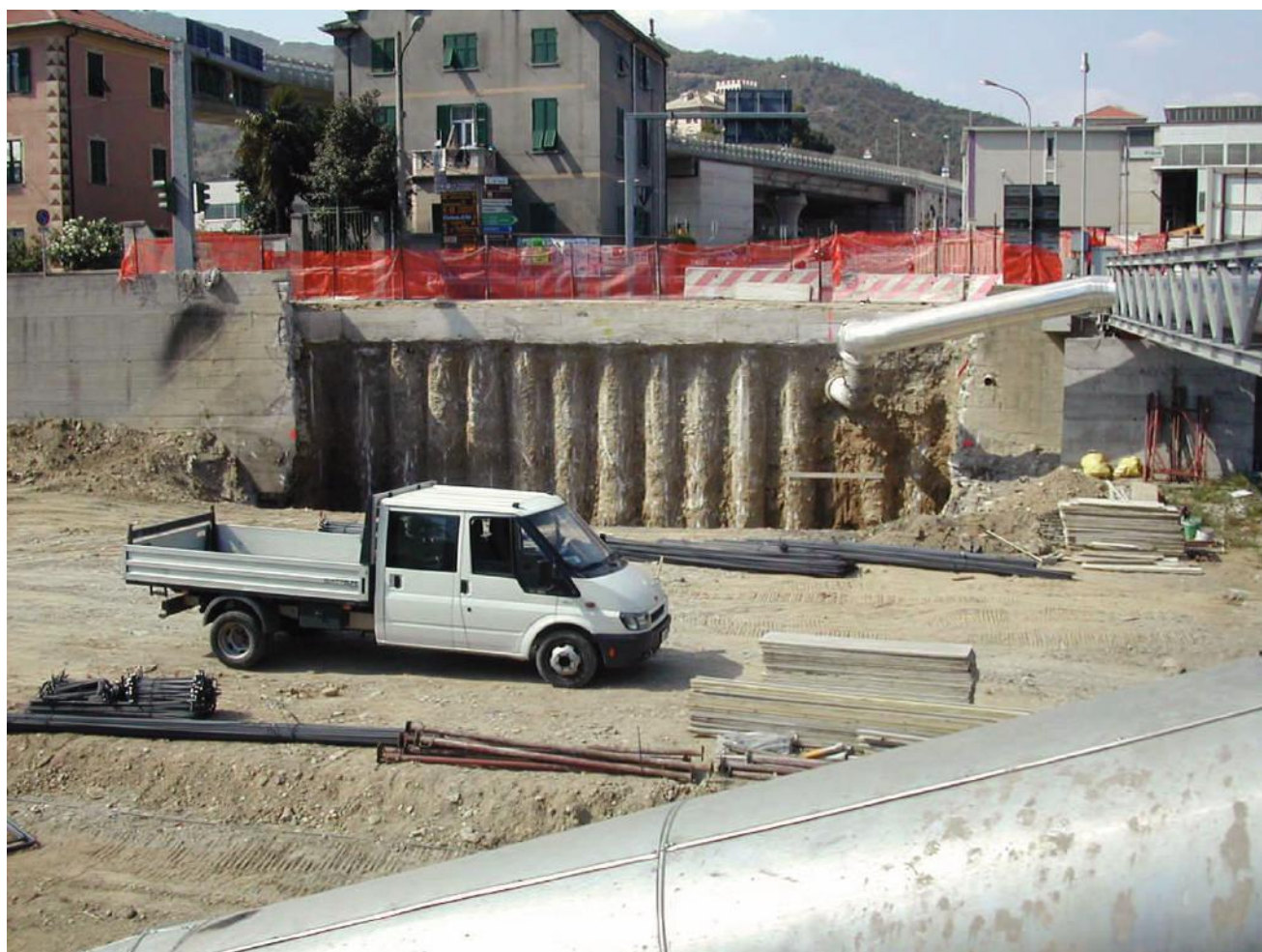
Foto 34 – Paratia a protezione spalle ponte sul Torrente Segno a Vado Ligure