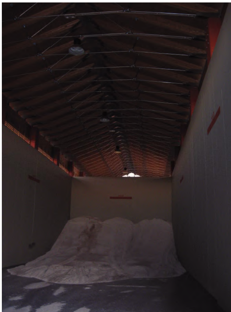
Foto 38 – ATS deposito salgemma presso Posto Manutenzione Mondovì