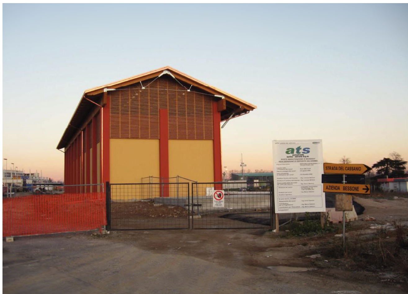
Foto 37 – ATS deposito salgemma presso Posto Manutenzione Mondovi