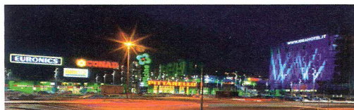
sma - cogoletto